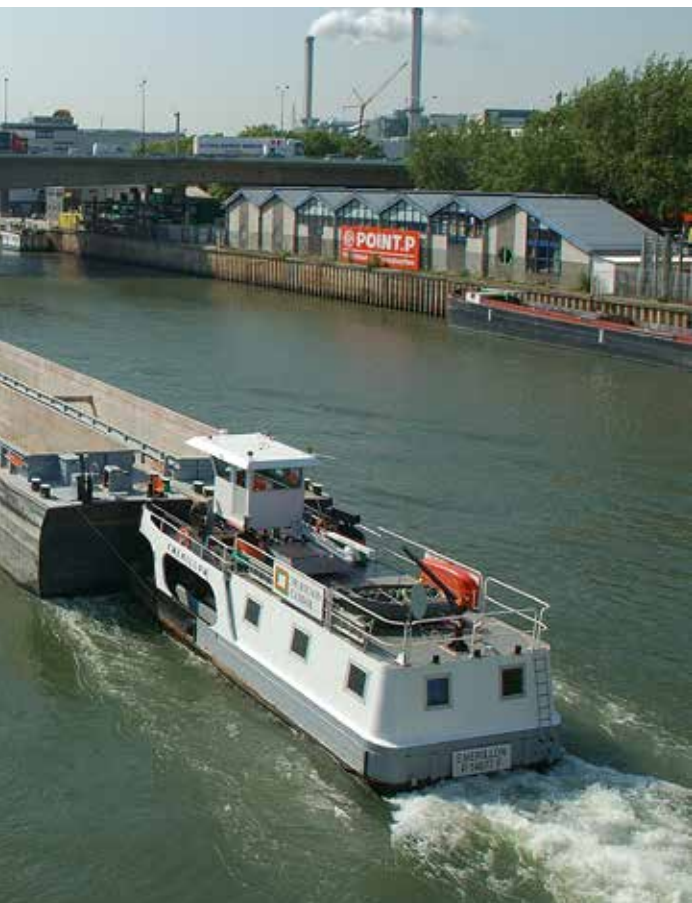
Port autonome de Paris

→ → MISE EN PLACE D'UN DISPOSITIF DE SURAMORTISSEMENT SUR LES BATEAUX FLUVIAUX ET MARITIMES NEUFS , équipés d'une motorisation propre, et les remotorisations propres de bateaux fluviaux existants, dans le cadre d'un accord à construire avec les armateurs sur une trajectoire de verdissement.