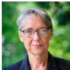
Terra - A. Bouissou

Tous ensemble, nous allons répondre à ce formidable enjeu qu'est la transition écologique des mobilités !