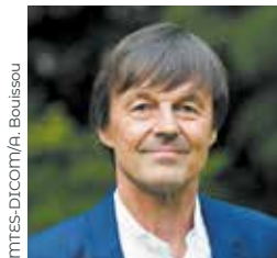
— Nicolas Hulot

Pour réussir, cette dynamique doit être collective. C'est en effet la responsabilité de l'État, de créer un cadre réglementaire et fiscal favorable à cette transformation, de déployer des infrastructures adaptées aux mobilités propres. C'est aussi la responsabilité des collectivités, qui organisent sur leurs territoires les mobilités. C'est enfin la responsabilité des entreprises et de chacun d'adopter, à chaque fois que cela est possible, un mode de transport le plus efficace et le plus propre possible.